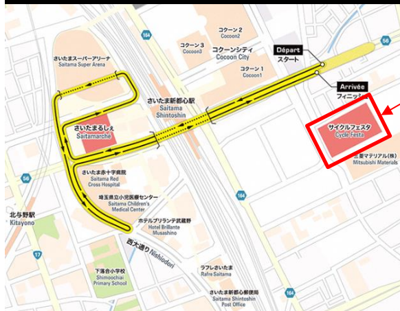
会場レイアウト・コース全体図